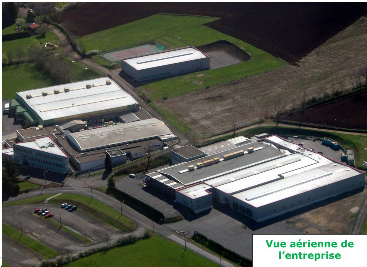
Vue aérienne de l'entreprise

Je peux dire que ce programme a pleinement répondu à mes attentes. Pour moi, ACAMAS est un accélérateur de réflexion, de décision et de mise en œuvre de plan d'action. »